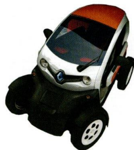
③ Quadricycle léger